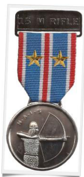
Médaille d'Argent avec étoiles