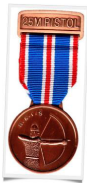
Médaille de bronze