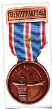
Médaille de bronze avec étoile