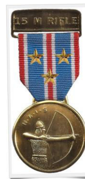
Médaille d'Or avec étoiles