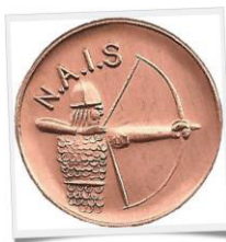
Insigne de Bronze