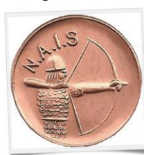
Insigne de Bronze